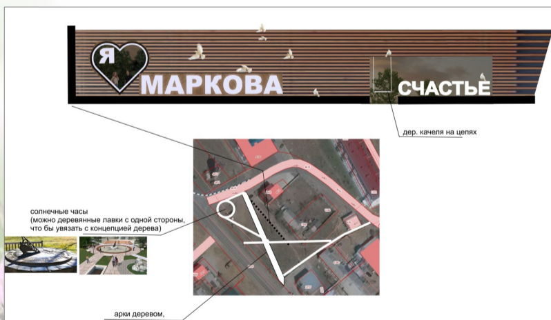
Проектная работа по реализации программы «Комфортная среда» в р.п. Маркова, ул. Мира, вблизи магазина Лидер