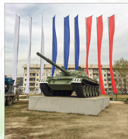
Флаги на территории мемориала