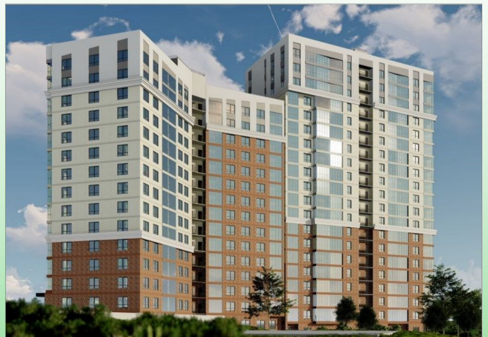
Строящийся объект: ЖК «Квартал Стрижи»

В декабре 2019 года мы завершили основные работы и сдали последнюю блок-секцию квартала — высотную баину «Небо», которая стала не просто домом, это поистине интеллектуальный объект, заставляющий восхищаться и задуматься.