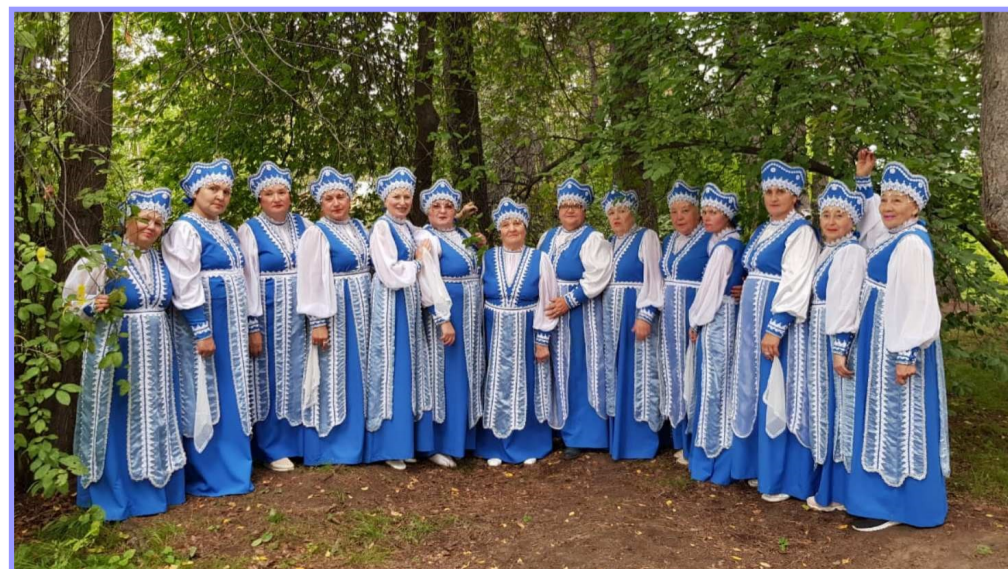
Народный вокальный ансамбль «Рябинушка»