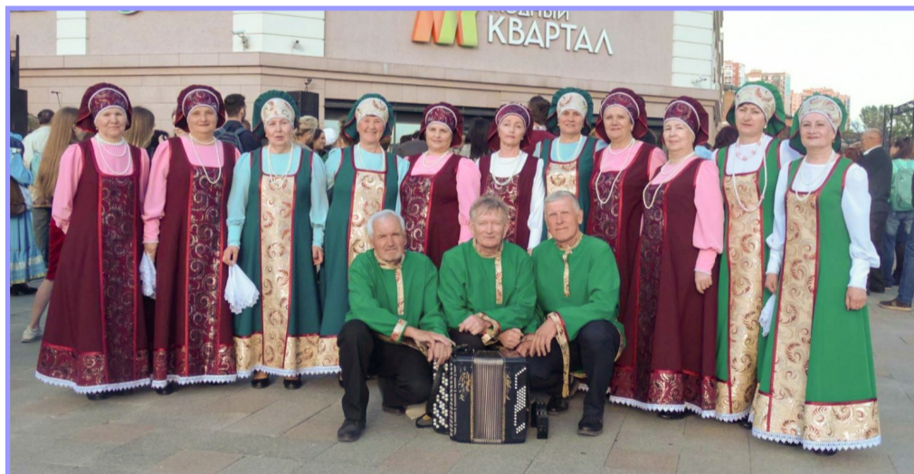
Хор русской песни «Луговые росы»

В концертном зале Иркутского Государственного университета, г. Иркутск, состоялся ежегодный региональный этап Всероссийского хорового фестиваля. В Иркутской области фестиваль организовало и проводило Иркутское региональное отделение Всероссийского хорового общества при поддержке Министерства культуры и архивов Иркутской области. Из-за ограничительных мер по коронавирусу (COVID-19), фестиваль решено было провести в закрытой форме, без зрителей, но в присутствии членов жюри. Участникам коллективов было рекомендовано